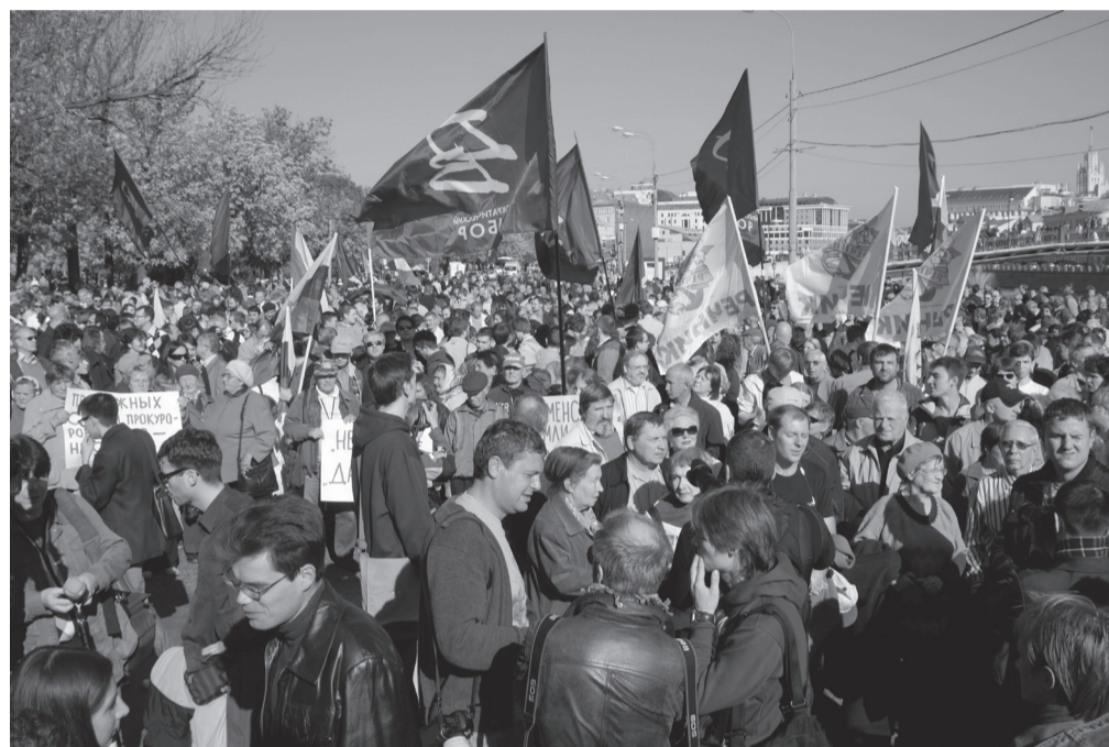
Массовый митинг оппозиции за прямые выборы мэра Москвы на Болотной площади, 25 сентября 2010 г.

Главное, чтобы эти выборы были свободными, честными. Просто так власть на это не пойдет – мы должны потребовать этого. Выйти на площадь и заявить свои права. Только если нас будет много, мы сможем заставить власти нас услышать.