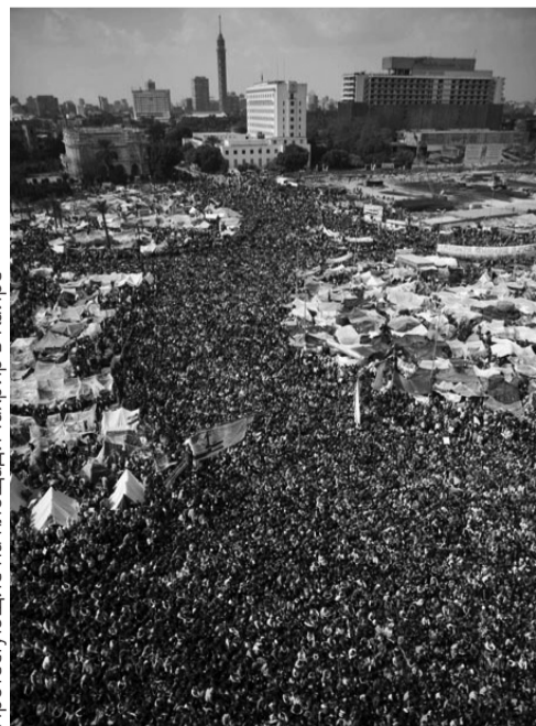
Протестующие на площади Тахрир в Каире

Бурные и совершенно неожиданные революционные события в арабских странах заставили многих в России задуматься о том, насколько нечто подобное возможно в нашей стране. Поразительно, что сама постановка вопроса об этом уже никого не удивляет. Хотя вроде бы в последние годы нам много твердили о «стабильности», достигнутой ценой жесткой цензуры, уничтожения свободомыслия, исчезновения свободных выборов.